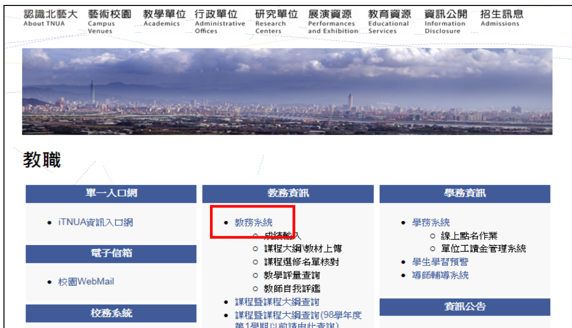
圖二：新教師服務入口連結