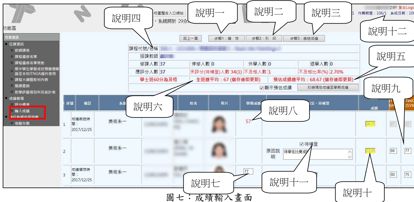
圖七：成績輸入畫面

說明一：點選「儲存」按鈕，將儲存已輸入或修改之學期成績及評分標準所設定之成績項目。