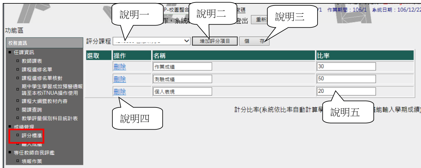
圖五：評分標準輸入畫面