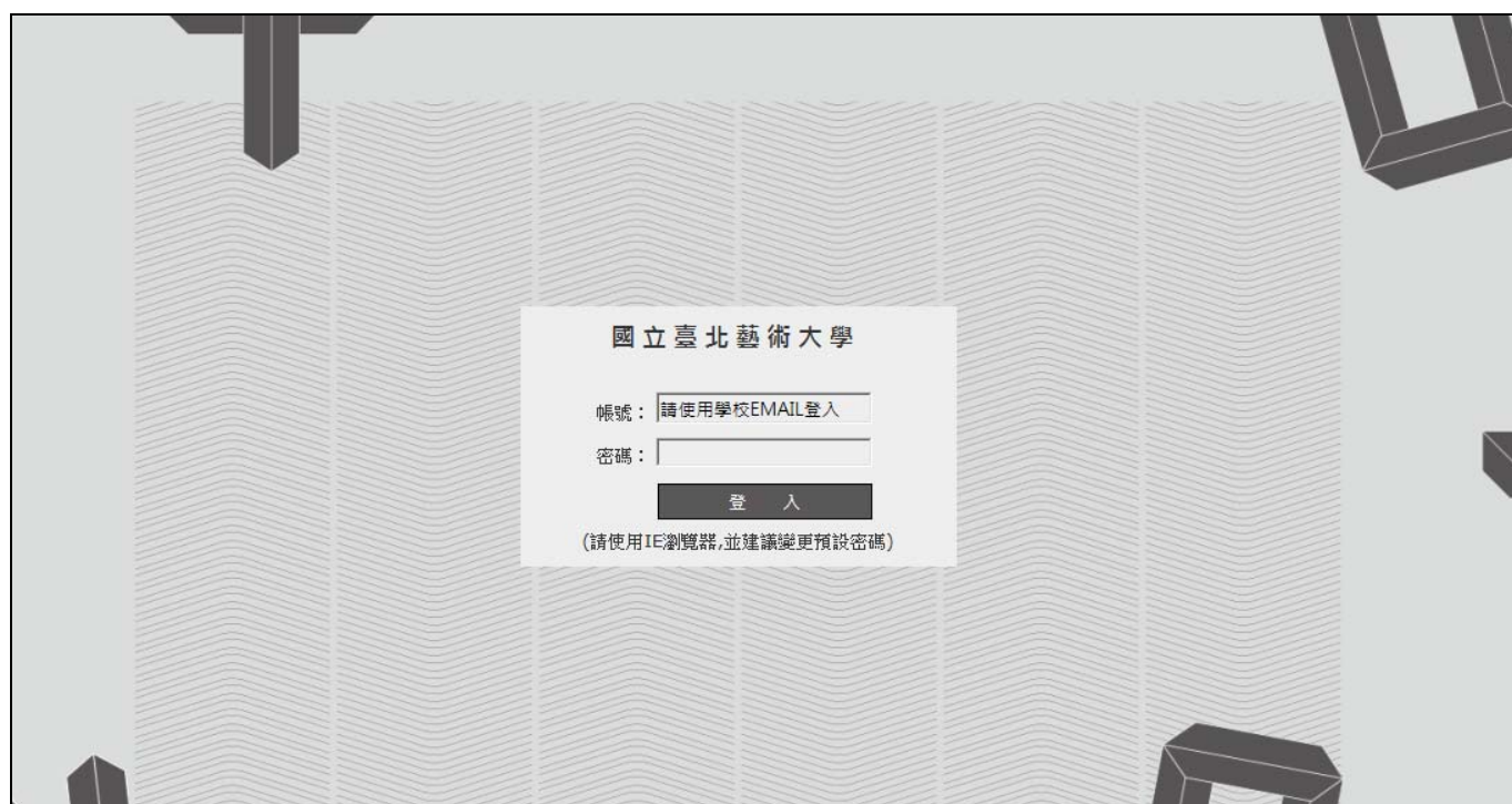
圖三：新教師服務登入入口